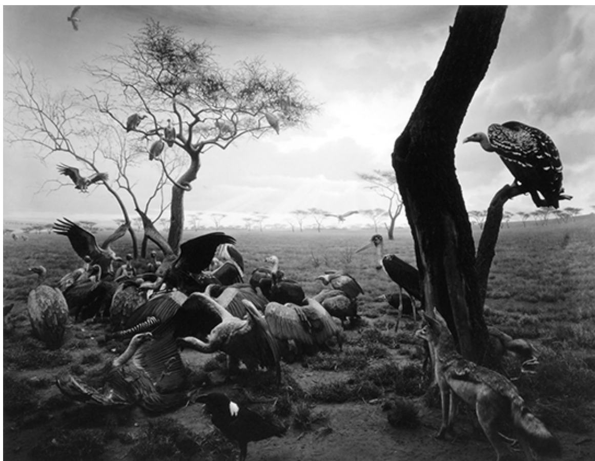
Voltors i hiena