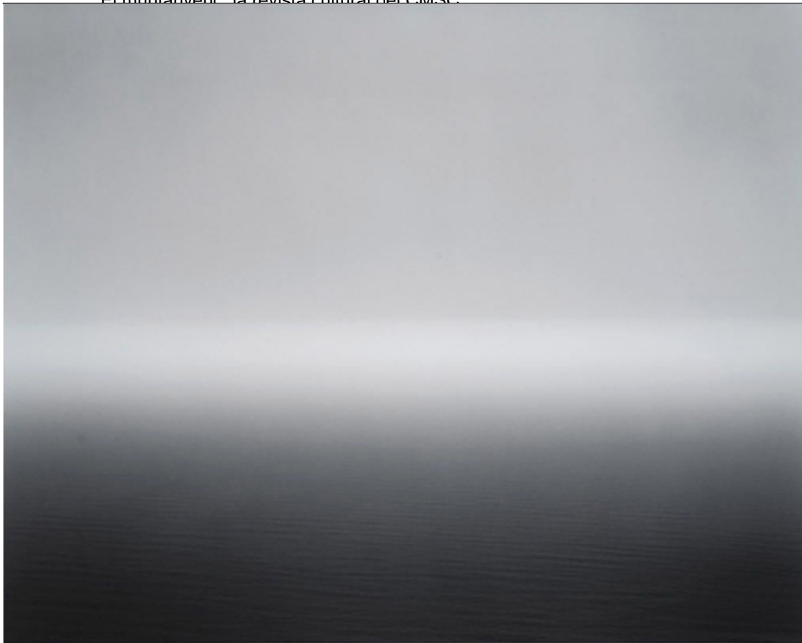
Paisatge marí