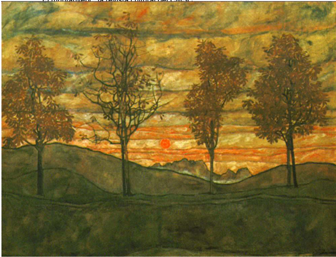
Quatre arbres. Egon Schiele. Viena

Altres articles de la mateixa autora a “elmuntanyenc”: